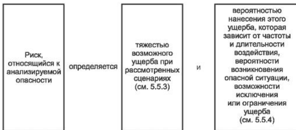
Рисунок 3 - Риск и его составляющие

Более подробно о составляющих риска и о процессе определения уровня тяжести возможного ущерба и уровня вероятности возникновения такого ущерба изложено в 5.5.3 и 5.5.4 соответственно.