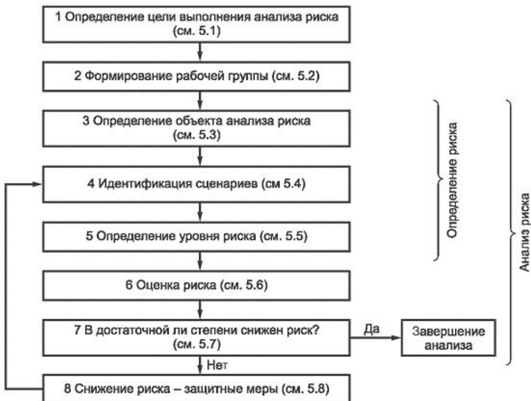
Рисунок 1 - Схема выполнения анализа и снижения риска